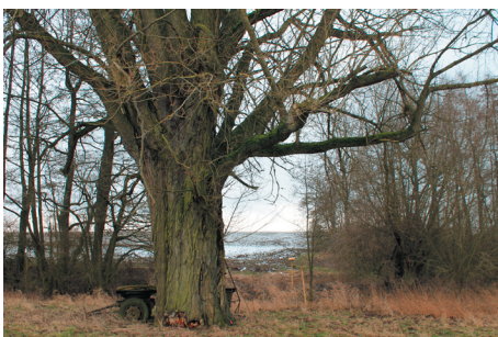
Schwarz-Pappel ( Populus nigra ) - Wurzelraum als Tabufläche