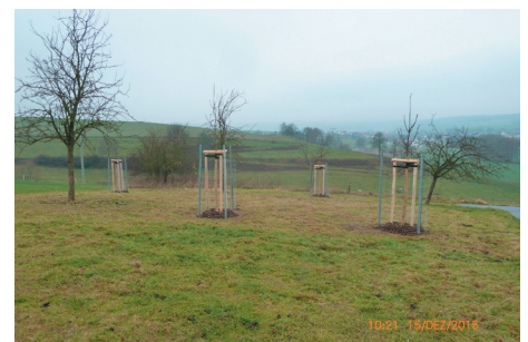
Ersatzpflanzung von Obstbäumen als Ausgleichsmaßnahme auf einer vorhandenen lückigen, ortsnah gelegenen Streuobstwiese