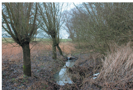
Madel: Optimierung des Trassenverlaufes bei Querung von naturnahem Gewässerabschnitt